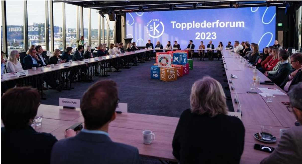
Deltakere sitter rundt langbordet på topplederforum 2023.

Det ble også sendt ut en evaluering i etterkant av Topplederforum i november 2021. Tilbakemeldinger fra evalueringen etterspurte mer strukturert nettverksbygging og erfaringsutveksling.