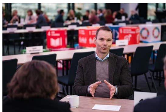
Bilde til høyre: Diskusjon på et gruppebord på Topplederforum 2023