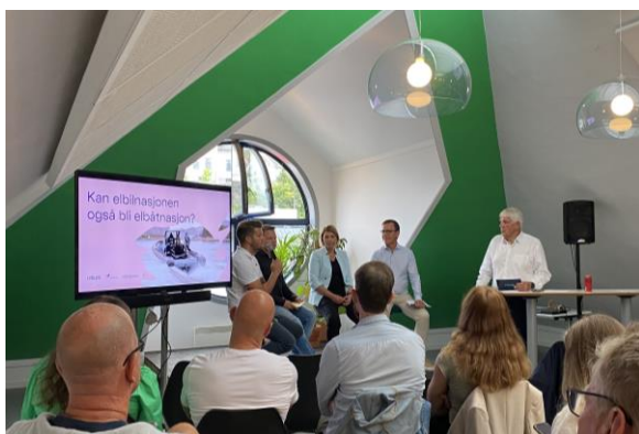
Bilde til venstre: Paneldeltakere tilstede på arrangementet "Kan elbilnasjonen også bli elbåtnasjonen?" under Arendalsuka 18.august i fjor.

I begynnelsen av 2022 lanserte vi nytt bærekraftsprogram i samarbeid med Innoventus Sør, Næringsforeningen og Greenstat, i regi av Innoventus Sør. "Bærekraft tuftet på profitt" er et program for bedrifter som ønsker å utforske og satse strategisk på bærekraftige forretningsmuligheter.