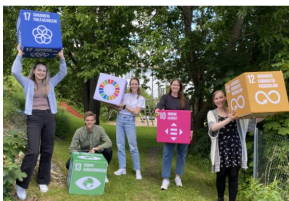
Bilde til høyre: 5 masterstudenter i sommerjobb hos Agder Fylkeskommune sommeren 2022, to av dem engasjert hos Klimapartnere Agder.

Under Arendalsuka ble det avholdt 6 arrangementer om temaer som grønne investeringer, EUs Green Deal, klimakommunikasjon, virkemiddelpolitikk og klimaregnskap - i samarbeid med aktører som Arendal Fossekompagni, Asplan Viak, Miljøfyrtårn, Klimapartnere Nasjonalt, m.fl.