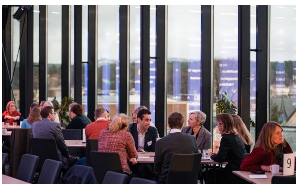
Bilde til venstre: Diskusjoner på gruppebordene på Topplederforum 2023.

Samhandling, erfaringsutveksling og dialog er suksesskriterier for vår verdiskaping. Gode og effektive møteplasser er derfor viktig. Sammen skal vi gå i front for å sikre grønn samfunns- og næringsutvikling.